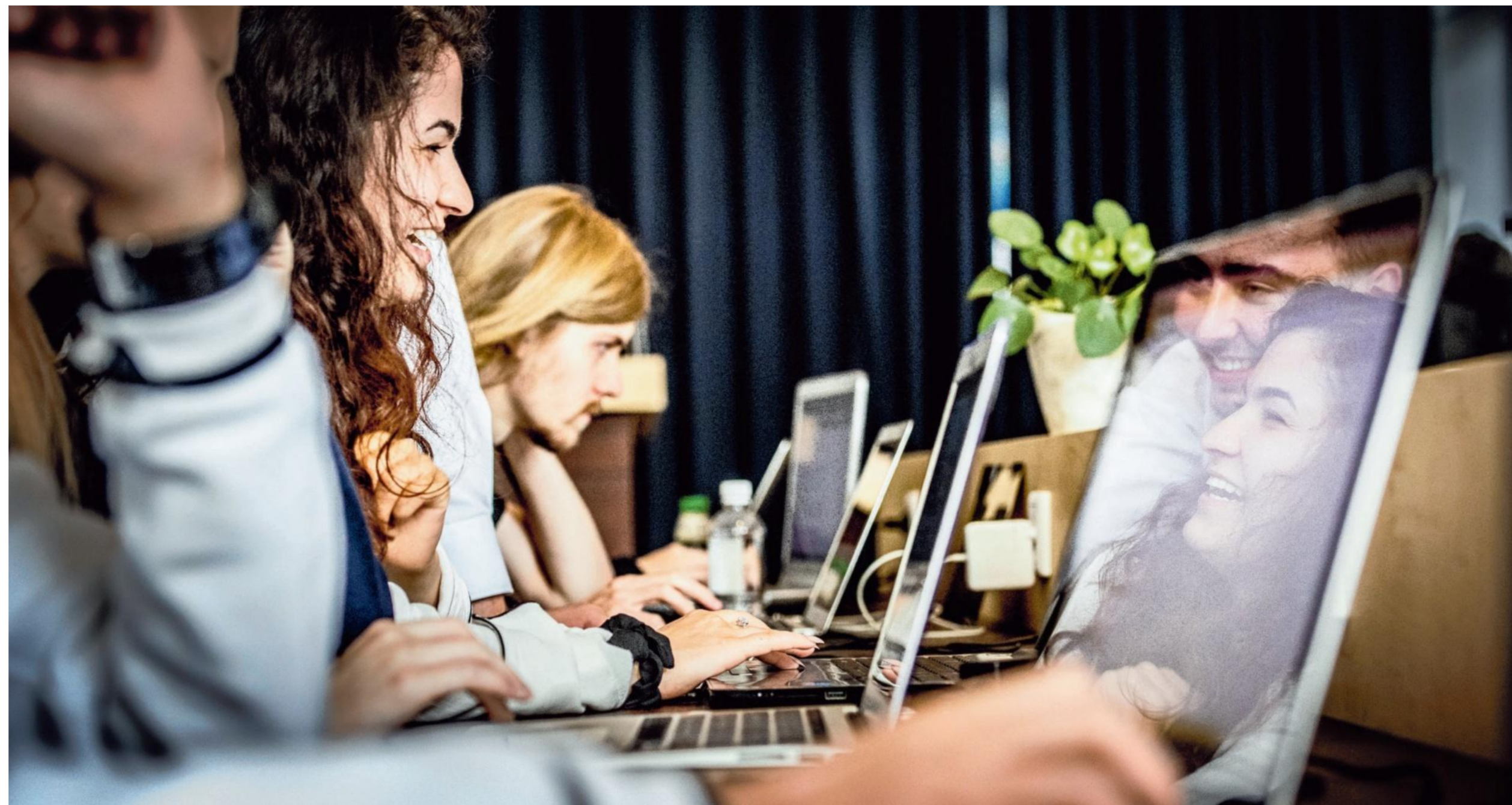
De deelnemers aan de pilotweek van de Cyberwerkplaats zitten tegenover elkaar in een kantoorpand in Rotterdam.

Bel snel op 085-0479888 of kijk op www.hcc-cruises.nl/aanbiedingen/cruises